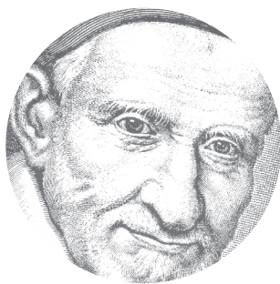
Vinzenz von Paul 1581–1660